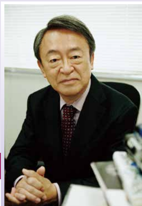
ジャーナリスト 池上彰 (いけがみあきら)

この度、池上彰氏とともに、コロナ禍におけるICTを活用した女性のための社会人の学び直しについて説明する機会を設けました。(新型コロナウイルス感染拡大の影響により、ライブ配信で行います。)