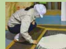
連携先: 招徳酒造 「酒造り体験」