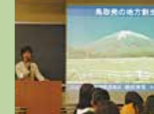
自治体担当者による 寄附講義