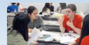
京都アメリカ大学コンソーシアム: アイビーリーグからの留学生の教育に 20年以上携わっている機関