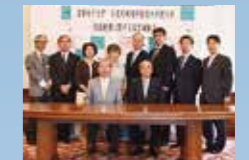
奈良先端科学技術大学院大学 との連携協定