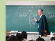
野村證券による寄附講義