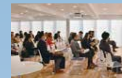
奈良女子大学との合同シンポジウム