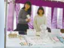
連携先: 東山南部地域活性化委員会 「太閤まつり」参加