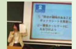
阪急電鉄による寄附講義