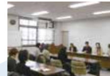
履修証明プログラム