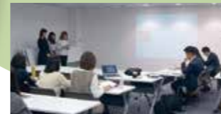
連携先: 阪急電鉄 「阪急京都線高架下事業提案」