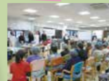
連携先: 東山警察署 「交通安全啓発イベント」