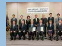
京都府立医科大学との 連携協定